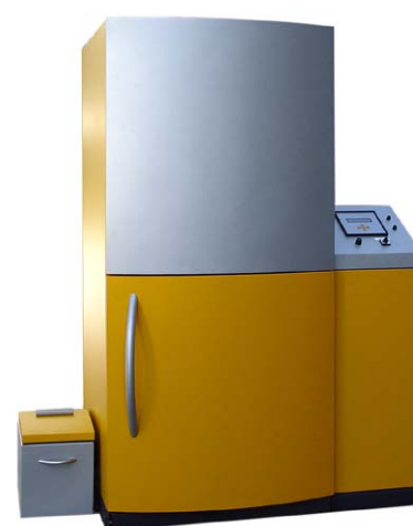
LIGNOplus 15

Im selben Sonderheft "test Spezial: Energie" ist auch der Test zu Kombi-Solaranlagen nochmals abgedruckt, mit unserem COMBI line Paket als Testsieger.